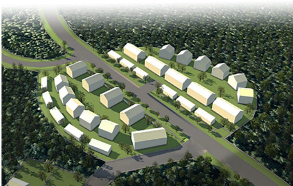
Pohjoinen portti pohjoisen suunnasta.