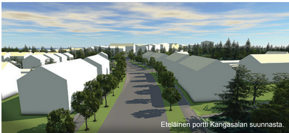
Eteläinen portti Kangasalan suunnasta.

Maastoon sovitukseen tulee kiinnittää erityistä huomiota. Puistonpuoleisilla rajoilla tulee noudattaa maaston luonnollisia korkeustasoja. Katuun rajoittuvilla rajoilla maaston korkeus sovitetaan kadun korkotasoon. Pihoille ja tonttien rajoille ei saa muodostua rumia vaikeasti hoidettavia jyrkkiä luiskia. Tarvittaessa korkeuseroja hoidetaan tukimuureilla. Kulkureitit toteutetaan mahdollisimman esteettöminä ja loivina. Jyrkemmillä rinnealueilla rakennukset voidaan toteuttaa rinneratkaisuin siten, että alin kerros upotetaan osittain rinteeseen.