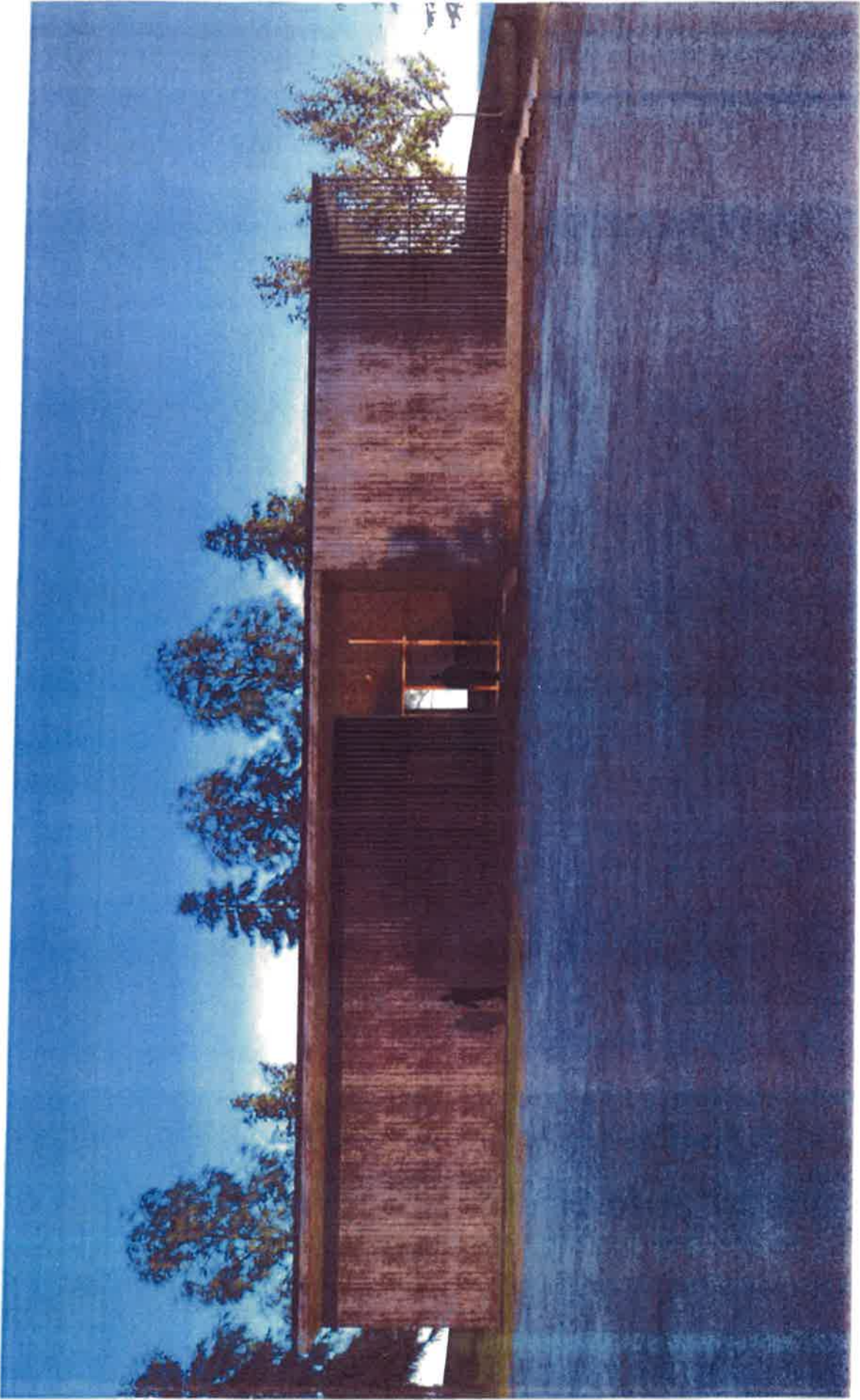
Teisko church maintenance and celebration building