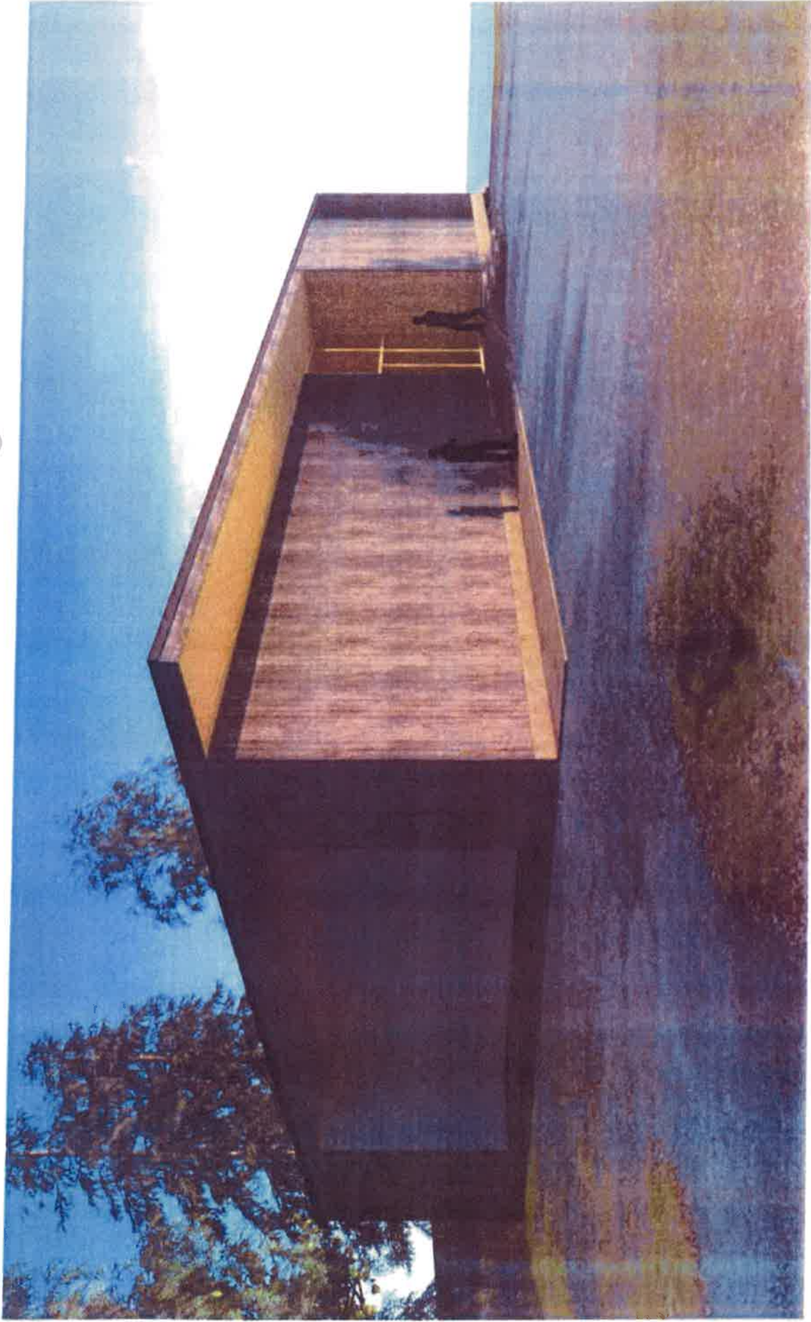
Teisko church maintenance and celebration building