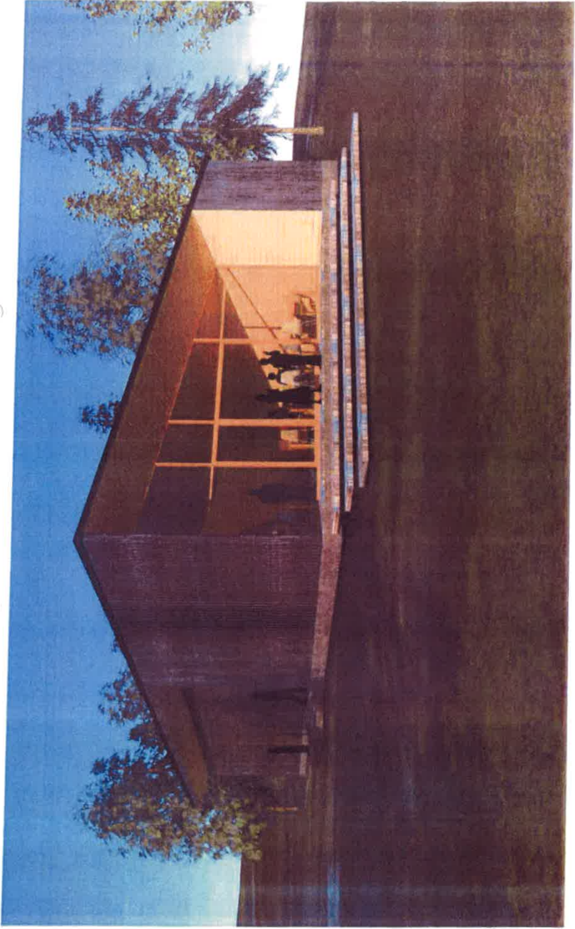
Teisko church maintenance and celebration building